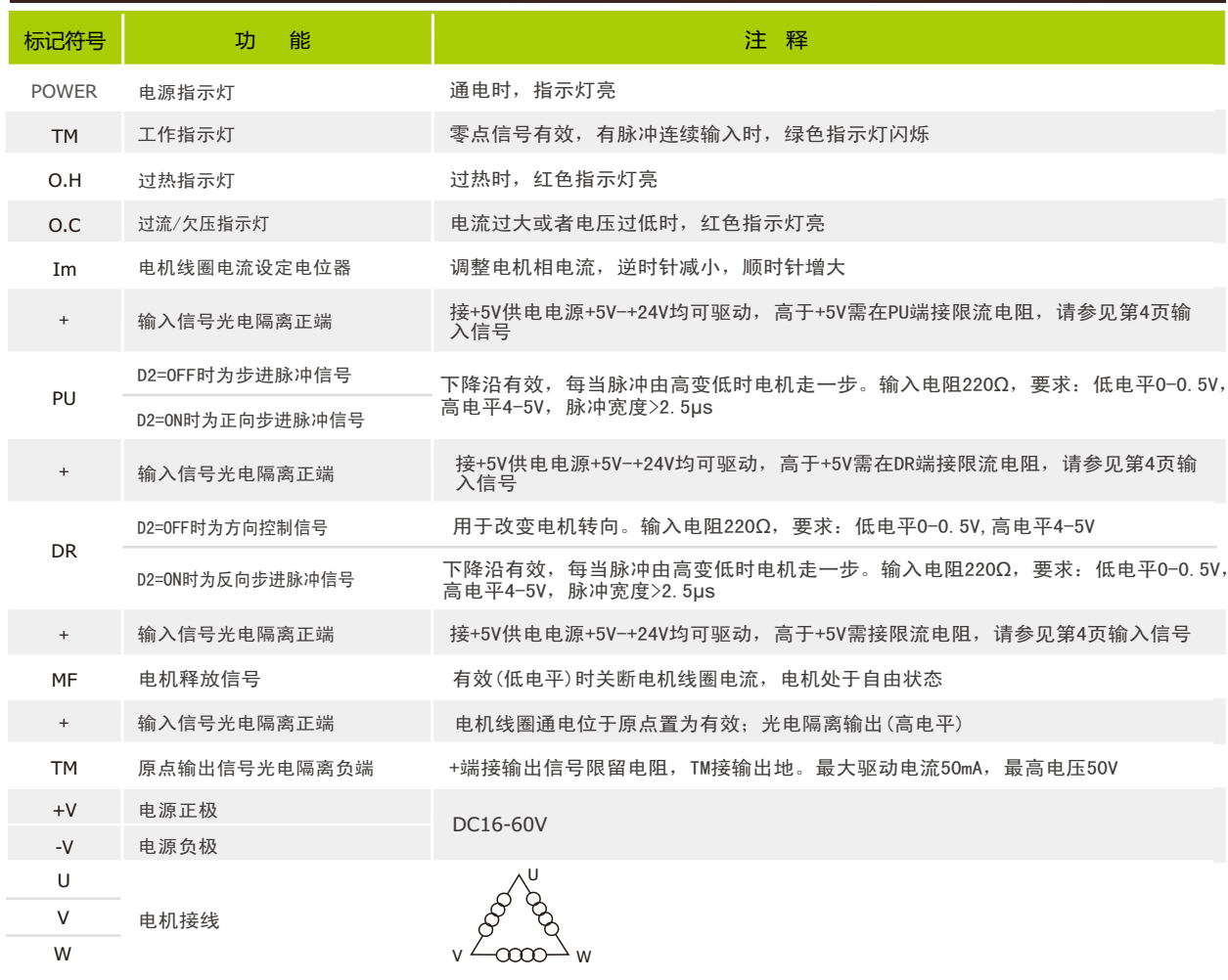
指示灯引脚功能说明